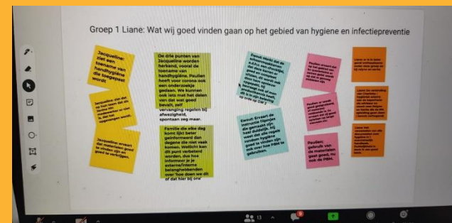
Impressie van de eerste werksessie 'Je hebt meer in huis dan je denkt' digitaal.